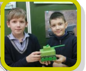
Выставка «Знатоки военной техники» в Бавленской школе