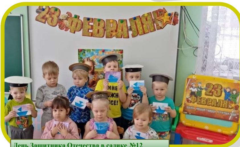
День Защитника Отечества в садике №12